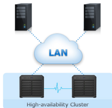
Figura 1) Fiabilidad, disponibilidad y recuperación de desastres

El administrador de High Availability garantiza una transición perfecta entre los servidores del clúster en caso de que falle un servidor con un mínimo impacto para las empresas.